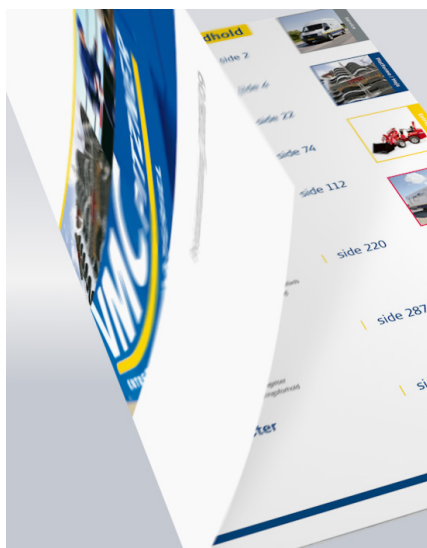
WebProof gør selv store katalogproduktioner overskuelige